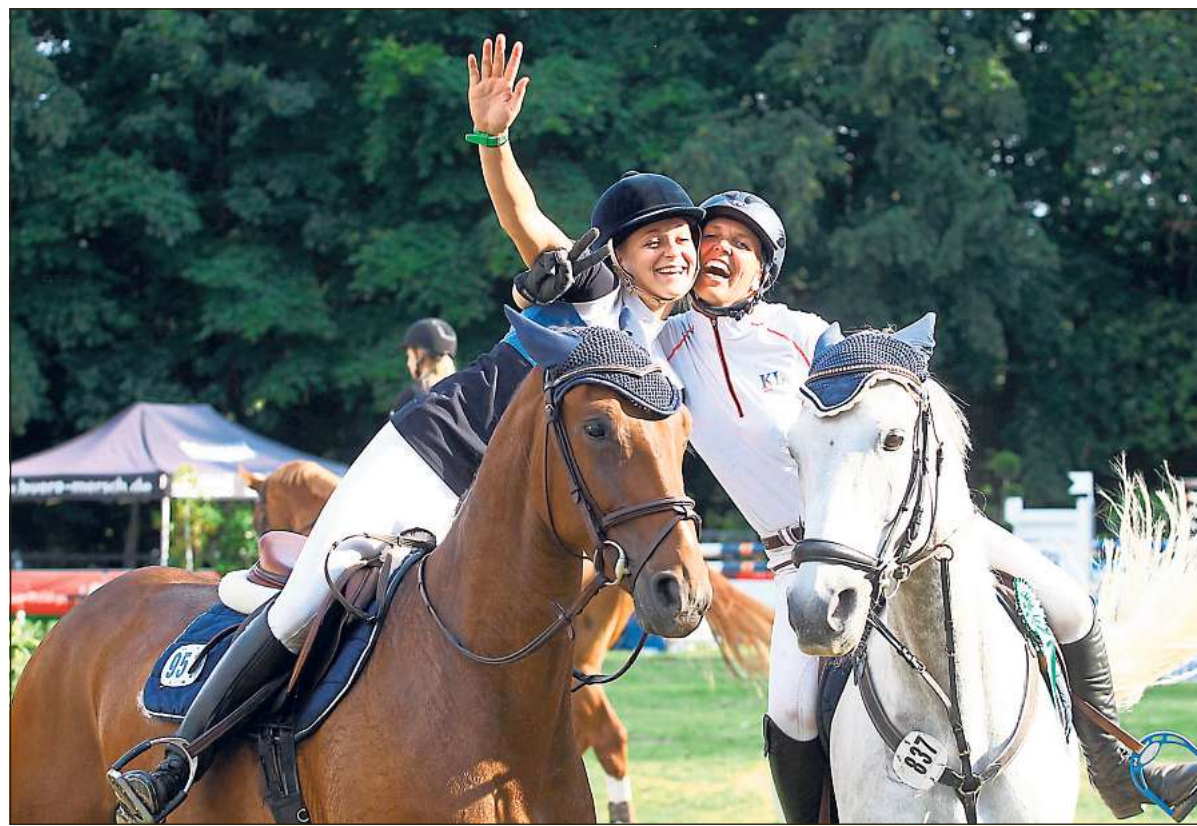
Einem ersten Eindruck von der Turnieratmosphäre beim Reiten erhalten die Besucher der Pferde-Stärken 2015 bei teilnehmenden Reit- und Fahrvereinen im Kreis Warendorf.