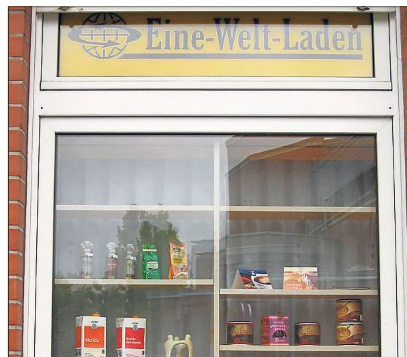
Dieses Fenster weist den Weg in der Axtbachgemeinde zur Lösung.